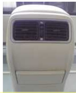
コンソール リアフィニッシャー