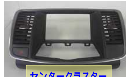
センタークラスター