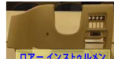
ローアーインストゥルメント パネル