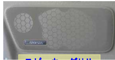
スピーカーグリル