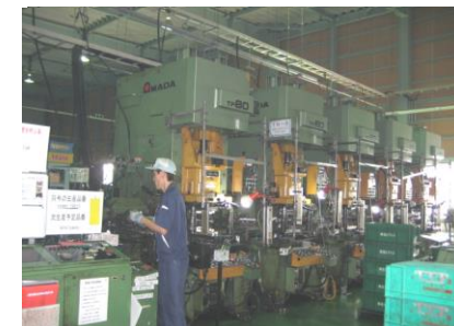
タンデム 80t x 5連