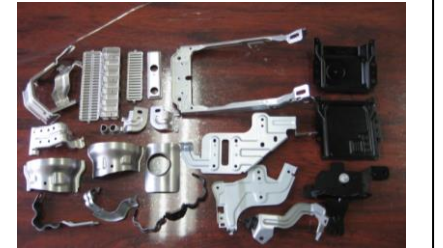
マフラー・インパネ・オーディオブラケット (本社生産品)