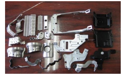
マフラー・インパネ・オーディオブラケット