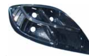
ランプリフレクター蒸着前 生地