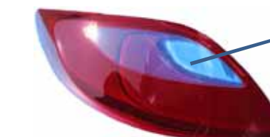
リアコンビランプレンズ一体成形品

透明の1次成形レンズを自動で2次レンズ金型へインサートし、2色のレンズを成形します。