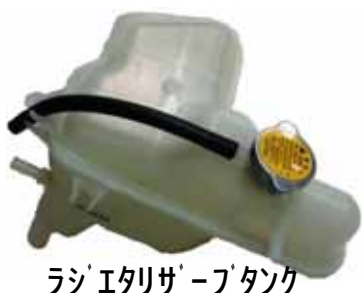
ラジエタリザーブタンク