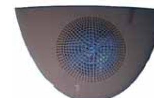
CPM スピーカーグリル