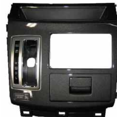
CPM センタークラスターAssy