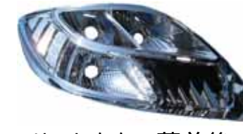
リフレクター蒸着後