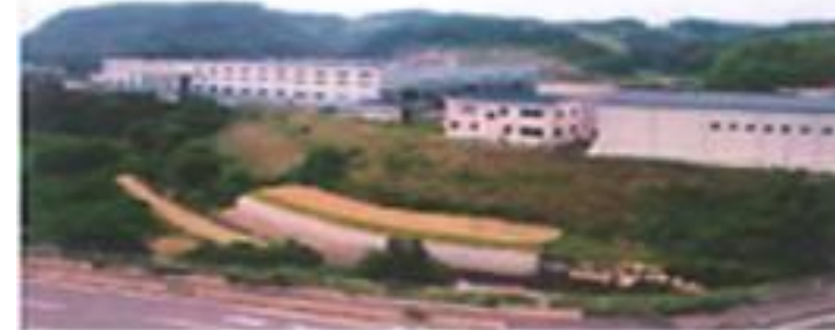
阿久根工場 73,201m 2 (22,143坪) 鹿児島県阿久根市波留字白崩3361 月生産能力 400トン

鹿児島県・阿久根工場では、伸線メッキから（現状は6価）までの一貫生産を行っています。