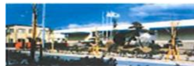
富田林工場 (JIS認定工場) 大阪府富田林市中野町東2丁目3番9号 月生産能力 600トン