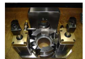
ダイカスト製品加工治具