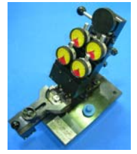
ラグプレート測定具