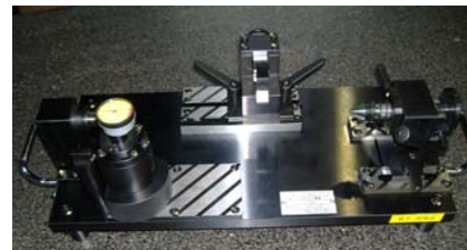
クランクシャフト測定具