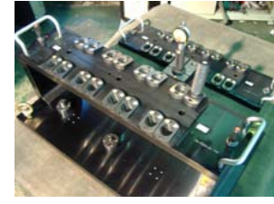
シリンダーヘッド検査ゲージ