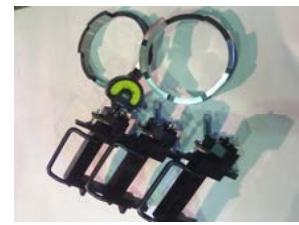
スプライン内径測定用ゲージ