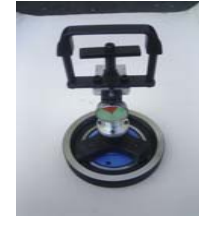
内径測定用ボアゲージ