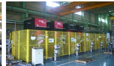
ビラ-FRボデーアッパ-インナ(大分)