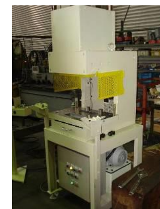
・自社製油圧プレス(外販)