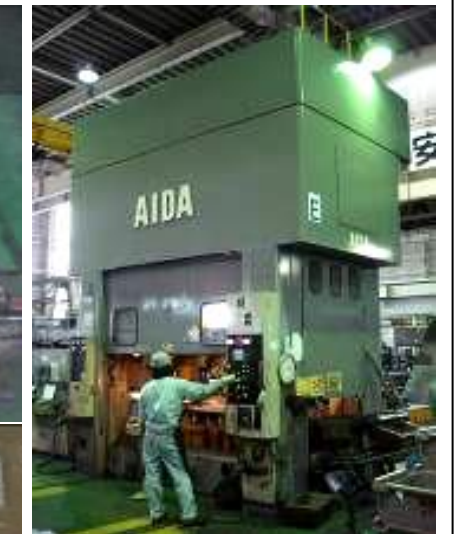
・400tリンクモーション