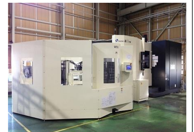
・MAKINO a81nx7面パレット仕様