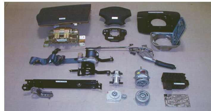
・弊社製造の各種製品