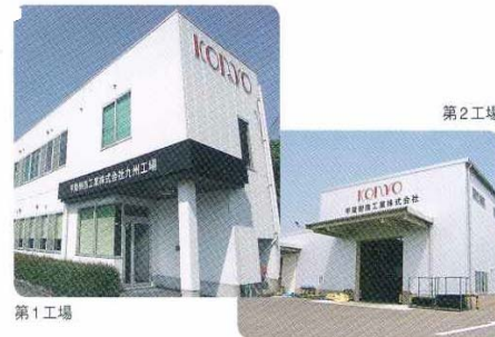
甲陵樹脂工業株式会社 九州工場

〒820-0202 福岡県嘉麻市山野1920番地 Tel.0948-42-1371 Fax.0948-83-5063 E-mail: JDGO4601@nifty.ne.jp