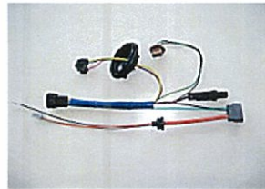
HIDヘッドランプ用ワイヤーハーネス