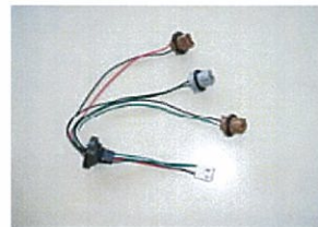
リアコンベクションランプ用ワイヤーハーネス