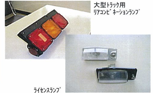
大型トラック用 リアコンベクションランプ