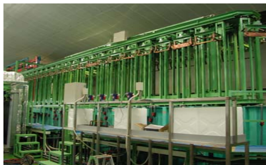
●全自動亜鉛めっき処理装置(ギンガライン)