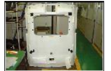
成形天井用緩衝材 チップフォーム、A-8