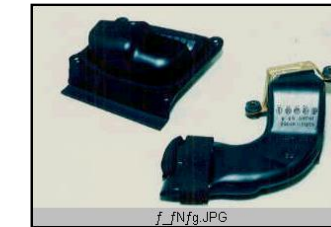
エンジンダクト用シール材 ESH、F-2、SC