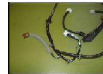
ワイヤーハーネス緩衝材 UEI-3 他