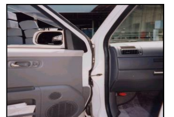
フロントフェンダーシール材 ESH、B-4