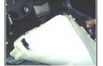
アンダーカーペット チップフォーム