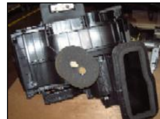
カーエアコンシール ESH、F-2、SC、EST-3