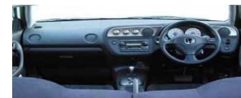
インパネ勘合部緩衝材・吸音材 F-2