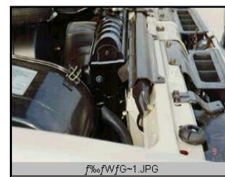
ラジエターグリルシール材 ESH-4