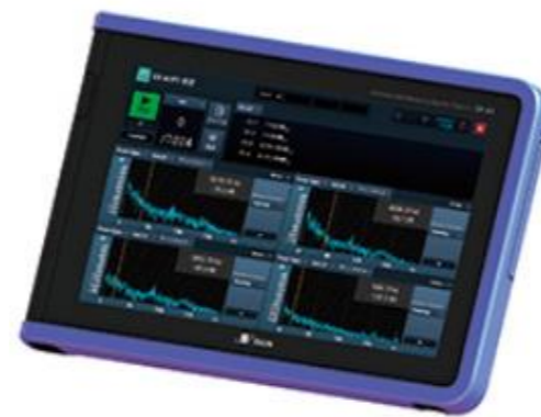
多機能計測システム SAA1