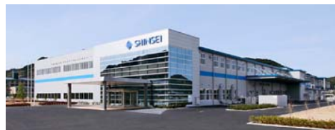
九州新生電子株式会社 佐世保工場