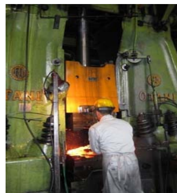
3.5トン エアースタンプハンマー