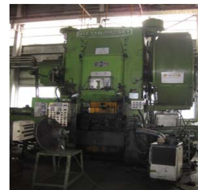
1500トン フォーシングプレス