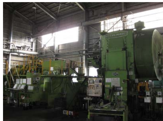
1200トン フォーシングプレス(TF)