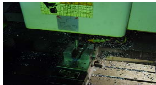
CADデータ作成後加工中 (1)