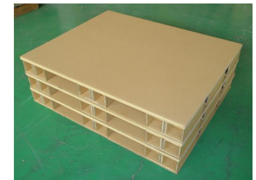
<ダンボールパレット>