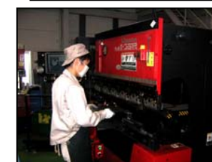
ネットワーク対応 ベンディングマシン