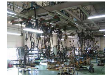
パネルバンS/Aライン