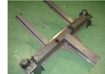
スローパー・リヤフロア・クロスメンバー