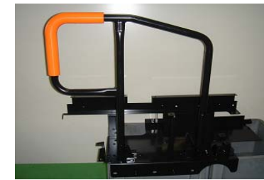
スローパー・グリップアッシ