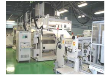
流動解析が可能です。