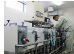
めっき試験ライン