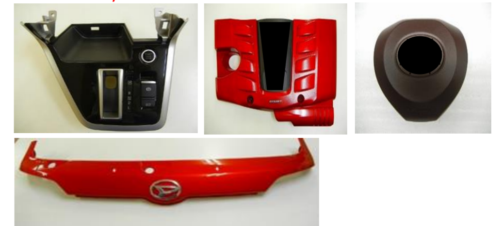
自動車塗装部品サンプル