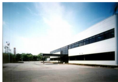
設計・開発拠点 佐倉R&Dセンター