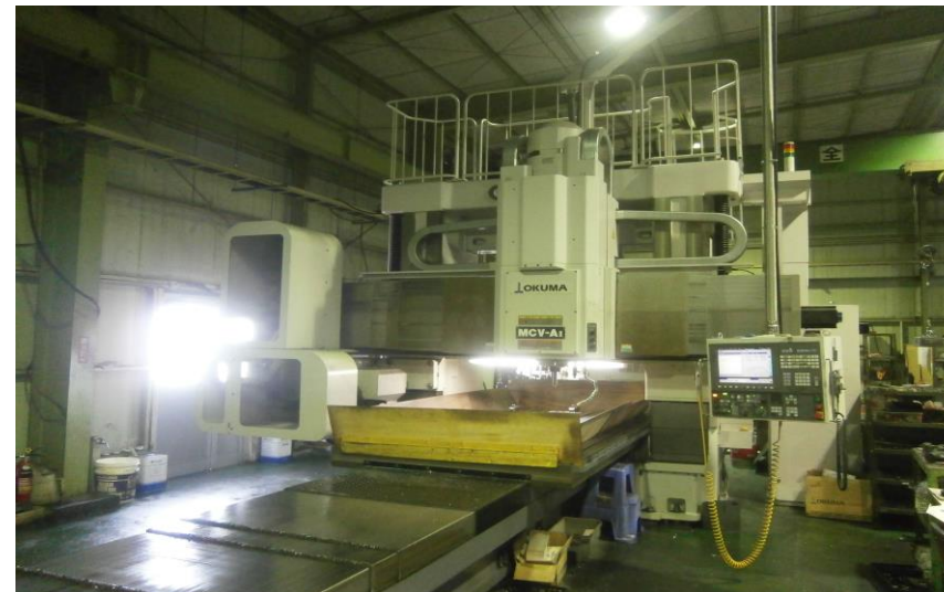
＜門形マシニングセンター MCV-A11 オークマ＞