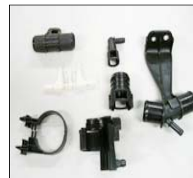
当社作成の金型による成形品