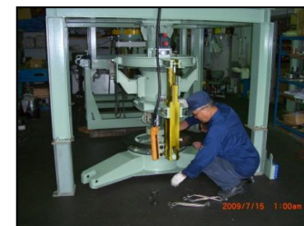
吹付け装置組立風