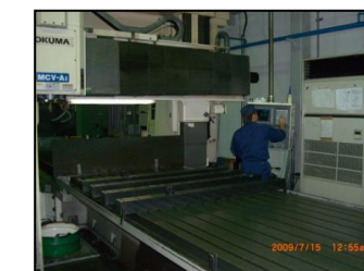
門型マシニングセン