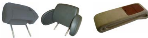
可動式一体成形ヘッドレスト