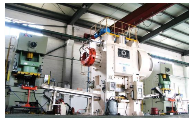
1000トン温間鍛造ライン