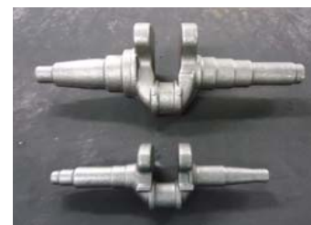
小型、中型クランクシャフト