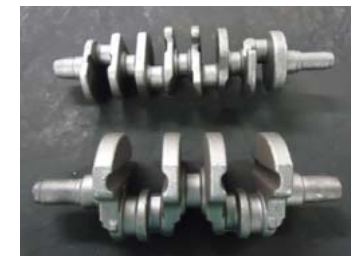
大型クランクシャフト