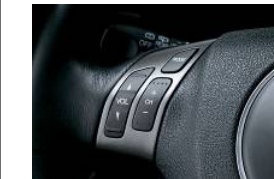
オーディオコントロール&クルーズセットスイッチ