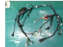
大型回路ハーネス