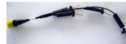
モータースポーツ F1用 イグニッション ハーネス