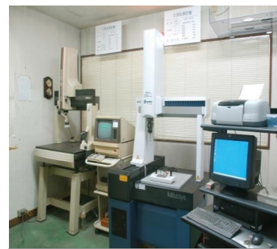
三次元測定機 「測って保証」