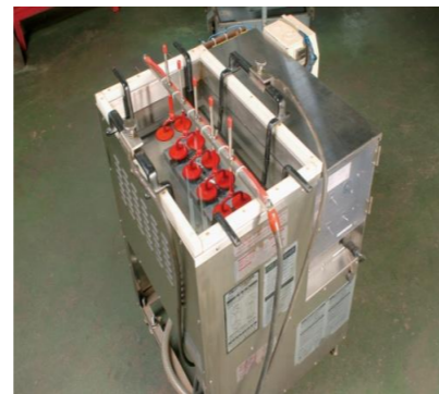
超音波洗浄機 「大切な金型のメンテに活躍」