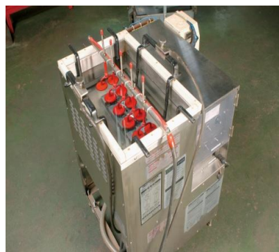
超音波洗浄機 「大切な金型のメンテに活躍」