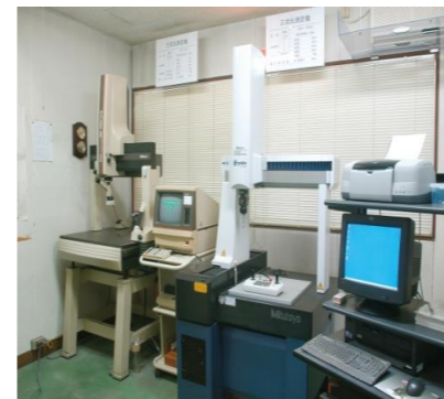
三次元測定機 「測って保証」