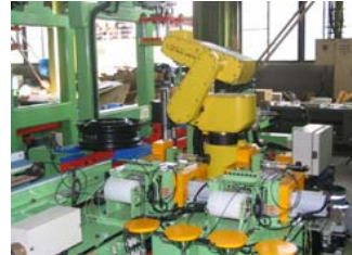
リントックス殿向け 最小点マーキング装置