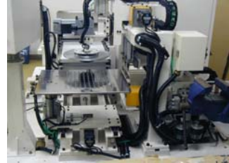
ノリタケスーパーアブレーション 殿向け ロール圧延機