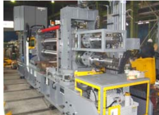
豊田スチールセンター殿向け カッタースタンド