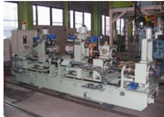
日新製鋼殿向けサイドトリマー