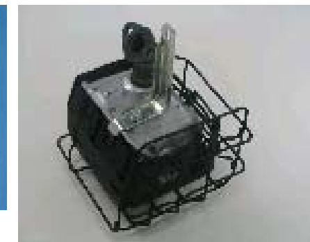
汎用エンジン用マフラー