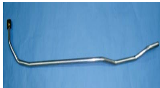
カーテンエアバック配管部品