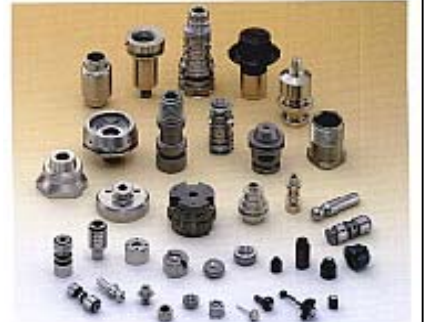
グループ会社製品