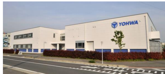
2007年5月に現在地へ移転し、新社屋となりました。