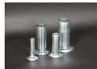
スピニング絞り品