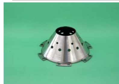
スピニング絞り品