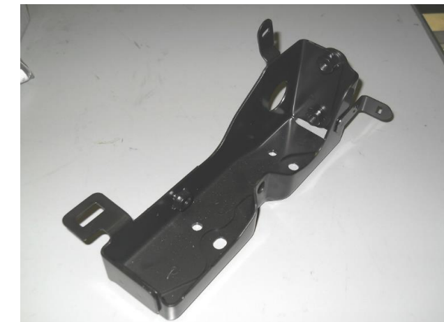
BKRT ASSY ECM MTG