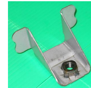
BKRT ASSY SEAT MTG