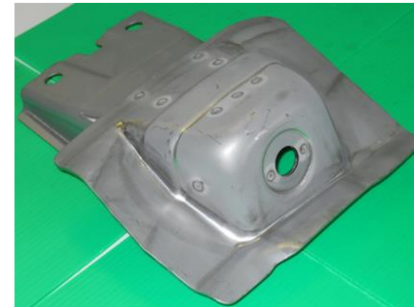
BKRT ASSY SHOCK ABS