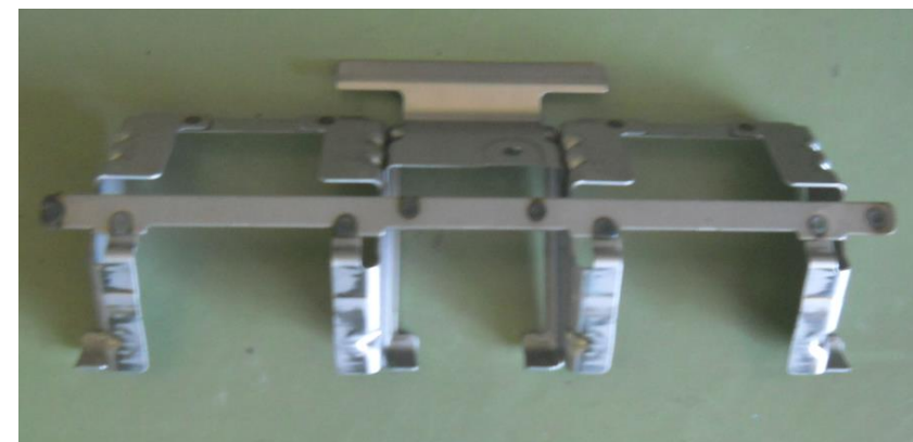
TAIL CROSS MBR