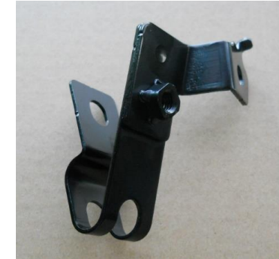
BRKT CABLE MTG