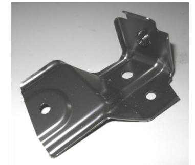
BKRT ASSY BMPR SIDE