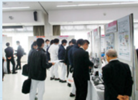
展示商談会の様子

各ブースでは本田技研工業(株)及び関連企業からの来場者へ熱心な説明や商談が行われました。