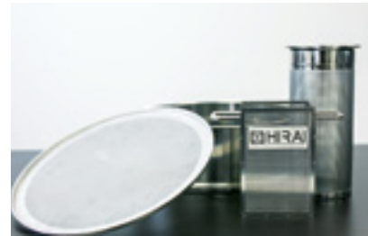
食品分野など販路を積極的に広げる

「興味を持ってくれる企業が多かった」と平井社長が振り返るのは、(公財)福岡県中小企業振興センターの紹介で、2月