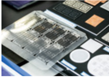
薄い金属を薬液で腐食させて加工する

エッチングは多様な金属を薬液で溶かし、求める形状をつくりだす加工法。薄手の金属の表面に、写真を現像する要領で膜を張り、薬品に