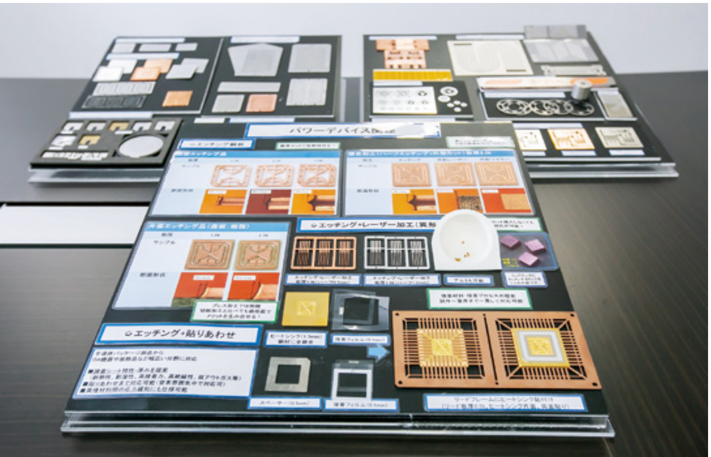
エッチングによる部品は多くの場所で使われている