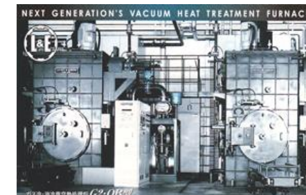
ガス冷・油冷真空熱処