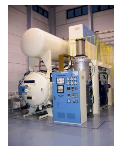
加圧式真空熱処理