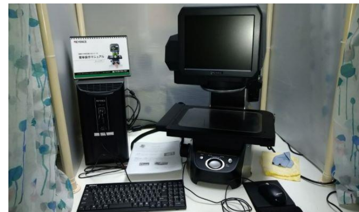
【④寸法測定(画像測定器)】