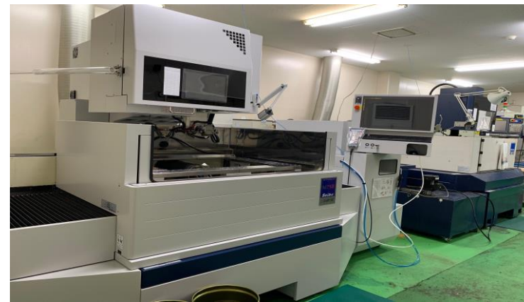
【①金型製作(ワイヤー加工機)】