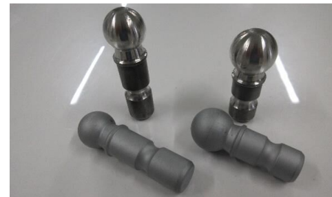
サスペンション関連部品