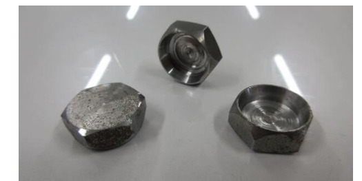
ブレーキ関連部品