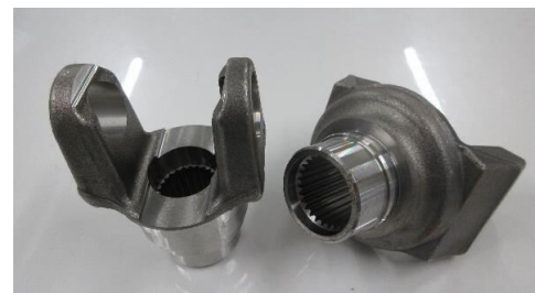
プロペラシャフト関連部品