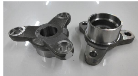
プロペラシャフト関連部品