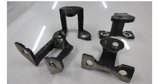
ブレーキ関連部品