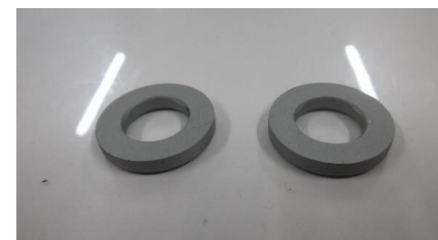
サスペンション関連部品