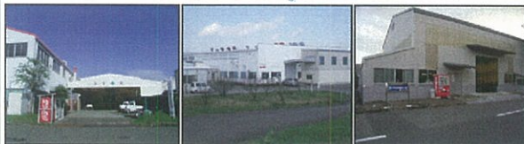
・本社工場 ・施工事業部 新富工場 (有)花菱精板工