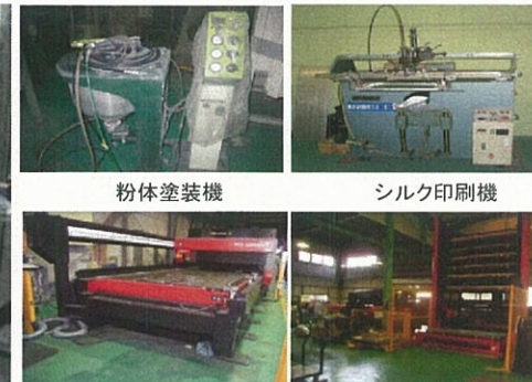
レーザー加工機 タレットパンチプレス