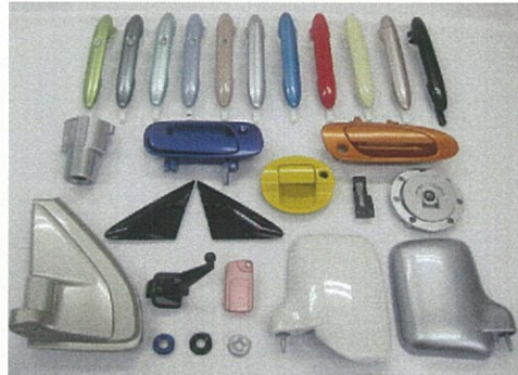
ホンダ(2輪・4輪各種) ダイハツ(4輪) トヨタ(4輪)