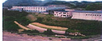
阿久根工場 73,201m 2 (22,143坪) 鹿児島県阿久根市波留字白前3361 月生産能力 400トン

鹿児島県・阿久根工場では、伸線材から(現状は6個)までの一貫生産を行っています。