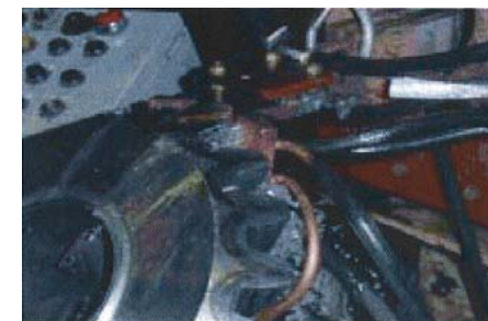
＜ベベルギヤ歯底焼入＞