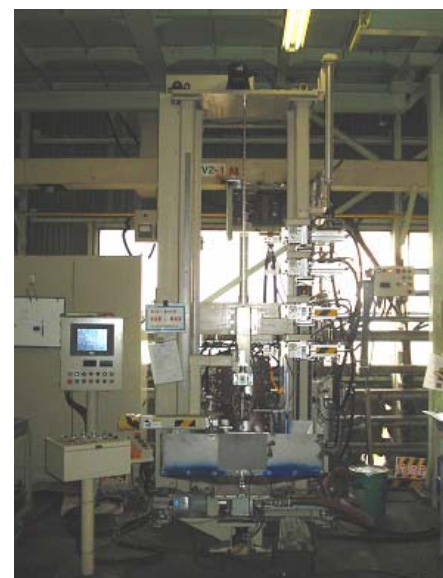
＜自動軸焼入機＞ 最大ワーク1500L