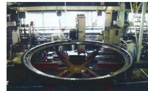
＜大型旋回ギヤ(2つ割り)歯面焼入れ 写真の様な大型ギヤも歪取まで行います。