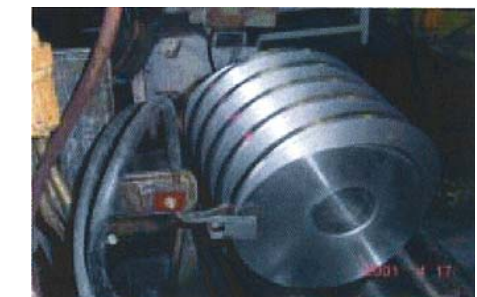
＜ウォームギヤ焼入＞