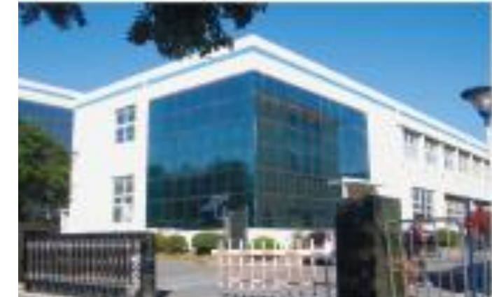
海外子会社: 大連新躍工業有限公司 (中国)