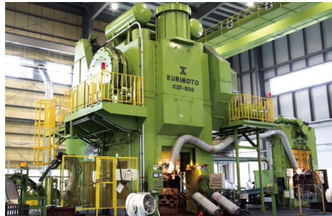
5000tフォーシングプレス