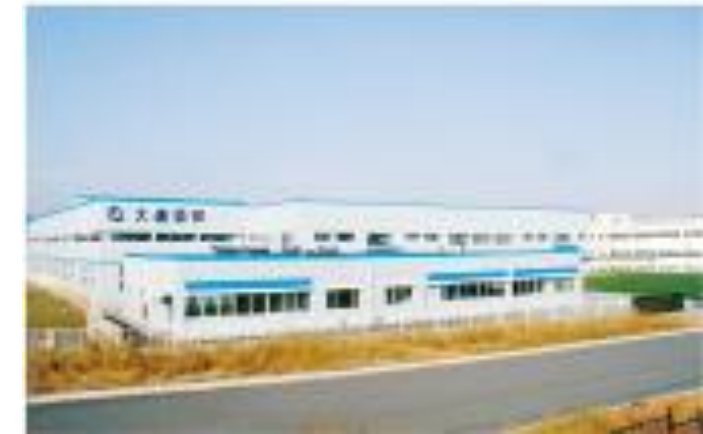
海外子会社: 大連柴田精密機械有限公司 (中国)