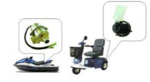
重要保安部品の加工・成形・組立