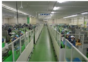
自動車部品組立ライン