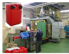
ガソリタンク製造(中空成形)