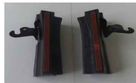
<プレス加工 & 組立>