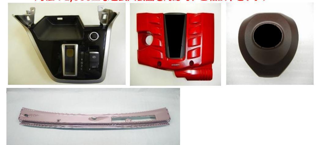
自動車塗装部品サンプル