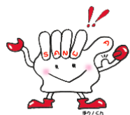
当社マスコットキャラクター