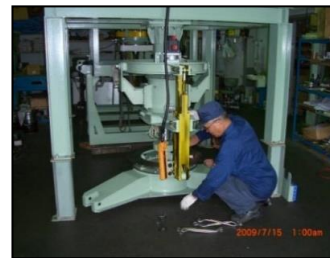
吹付け装置組立風景