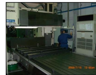
門型マシニングセンター