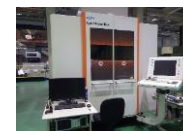
レーザー加工機 LASER1200 (アビエ・ショルマー)