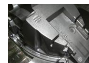
耐摩耗性、耐溶損性を高める表面改質

※自動車や家電製品の静音化の為に、製品の振動部分の見直しが図られています。そういった検討の中で成形品には必ず存在する金型分割ラインをなくしたいという要望がありました。当社では、その要望に応えるために新しい金型構造を考案し、量産化に成功しています。