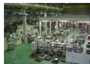
機能性、安全性に配慮した組立て作業場