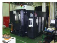
高精度マシニングセンター V22+ワークチェンジャー (MAKINO)

金型のランニングコストに関しても、経年変化が少なく耐久度の高い当社の金型はトラブルが少なく、無駄な修繕費を発生させません。