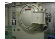
焼入れ温度1300℃まで対応できる加圧冷却式真空熱処理炉