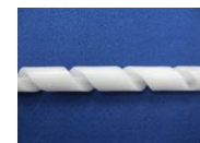
※ネジ部の全周に分割ラインがありません