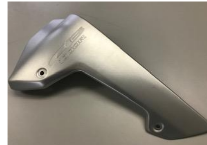
ホンダ系 プレート