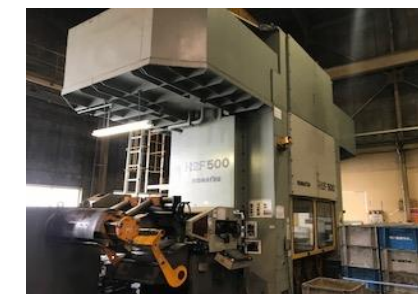
八雲設備コマツ500tサーボプレス