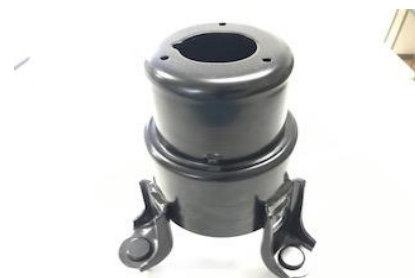
トヨタ系 防振マウント